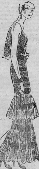
Modelo de gasa en colores verde, amarillo y anaranjado, con lazos del mismo género en el talle y el cuello